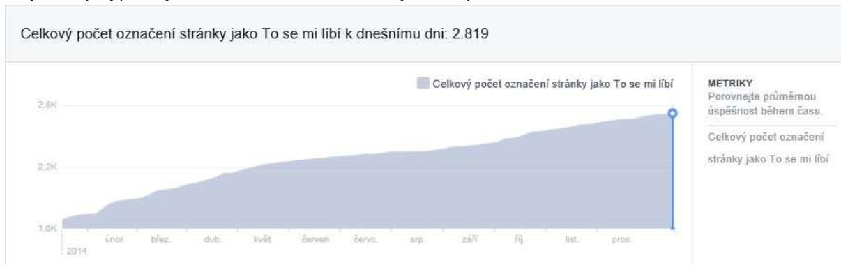
Graf č. 1: vývoj počtu fanoušků ČSTS na Facebooku v jednotlivých měsících roku 2014

Nejvyšší nárůst počtu fanoušků byl v období konání titulárních a mezinárodních soutěží na území ČR, a to zejména v lednu, únoru, březnu a říjnu, což je patrné z následujícího grafu.